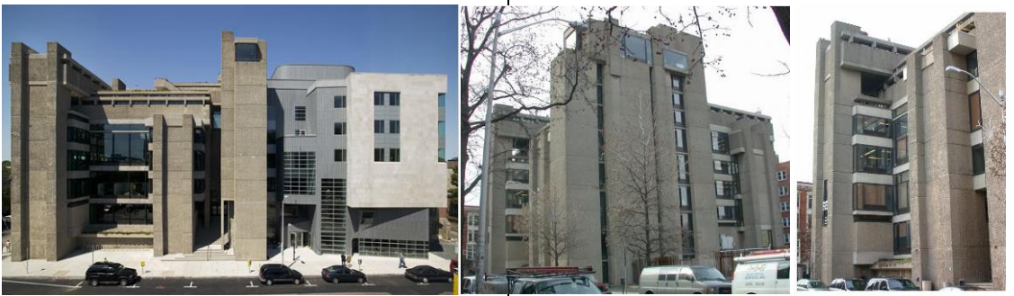
Art and Architecture Building, Yale (1958-1964) (耶魯大學建築系館) / Paul Rudolph

http://commons.wikimedia.org/wiki/File:Unit%C3%A9_d'Habitation_Typ_Berlin_%26_Corbusier-Haus,_Ostfassade.jpg