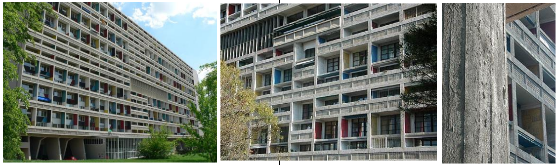
Unite d'Habitation (巴黎馬賽公寓) / Le Corbusier

代表人物：美國－勒·柯比意 (Le Corbusier)、保羅·魯道夫 (Paul Rudolph)、路易·康 (Louis Kahn)；英國－詹姆斯·斯特林爵士 (James Sterling)；日本－前川國男 (Maekawa Kunio)、丹下健三 (Kenzo Tange)