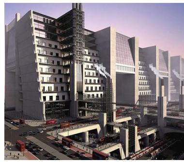
La Citta Nuova, 1914/ Antonio Sant'Elia

資料來源： http://victortsu.tumblr.com/page/48