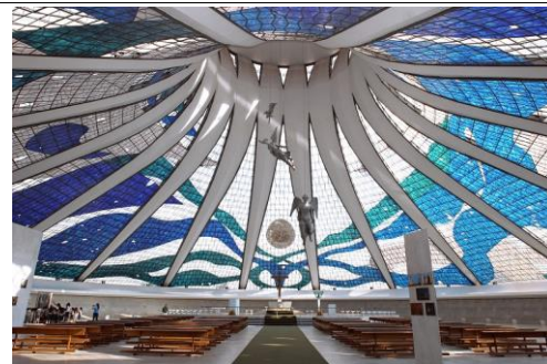
Catedral Metropolitana de Brasília (巴西利亞大教堂) (1960) / Oscar Niemeyer