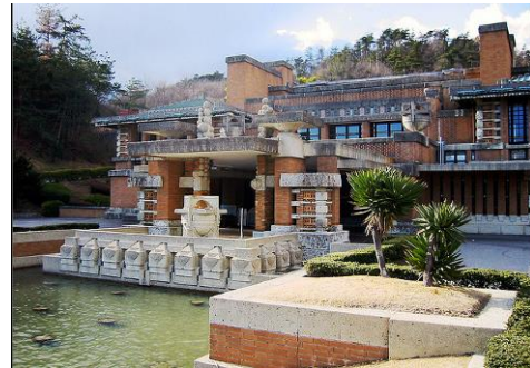
Frank Lloyd Wright's Imperial Hotel, Tokyo (opened 1923 – demolished 1968)