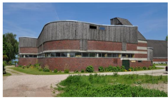
hugo häring, gut garkau, germany, 1923-1926

資料來源： http://anavedobomgosto.blogspot.tw/2011/05/gut-gurkau.html